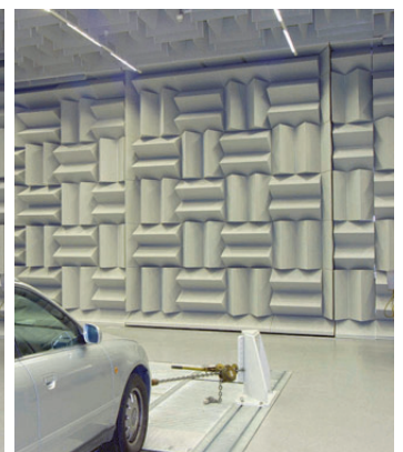
Hubtor offen, Schnell-Lauftor geschlossen

Die Angaben dieser Druckschrift entsprechen dem Stand unseres Wissens und entsprechen dem derzeitigen Stand der technischen Entwicklung. Änderungen bleiben vorbehalten. Gewährleistung nur aufgrund von Einzelverträgen bei Ausführung durch G+H Noise Control