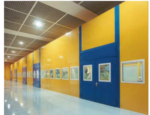
SONEX®-NP Entwicklungsprüfstände Automotiv-Industrie

Rauer Betrieb an der Kapsel selbst und vor allem auch des beweglichen Zubehörs, Montage von Messgeräten und anderen Geräten an Decken und Wänden der Prüfräume, Begehbarkeit der Decken etc. müssen Prü fzellen generell aushalten.