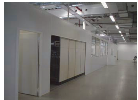
SONEX®-NP Prüfstand mit Rolltor