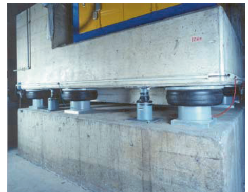
SONEX®-NP Prüfstände Reifenindustrie