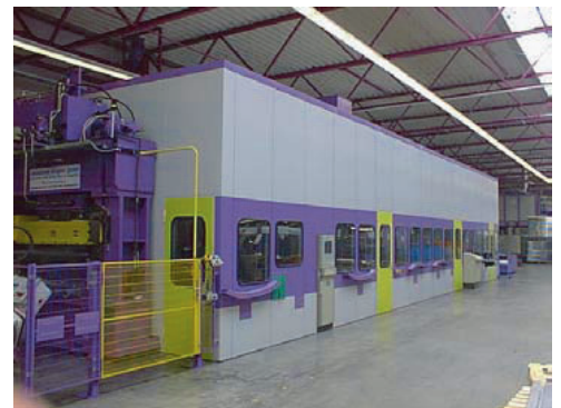
SONEX®-NP Prüfstände Reifenindustrie