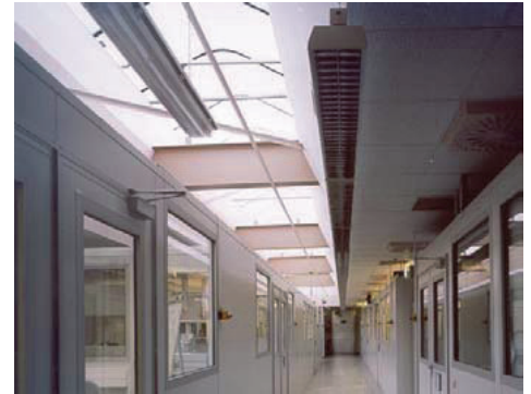
SONEX®-NP Entwicklungsprüfstände Automotiv-Industrie

Meist werden mehrere Prüfräume nebeneinander oder auch übereinander angeordnet. Verschiedene Maschinen strahlen in unterschiedlichen Frequenzen ab.