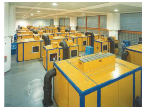
SONEX®-NP Prüfstände Reifenindustrie