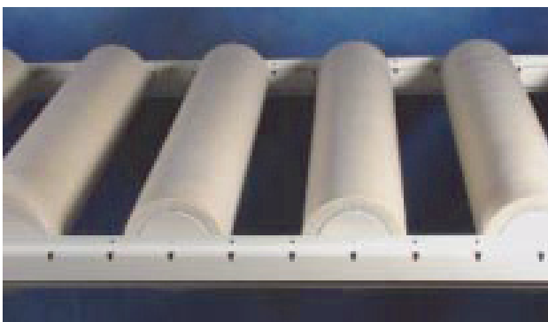
SONO® R in Trageprofil