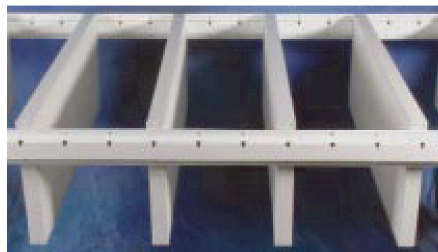
SONO® B in Trageprofil

Die Angaben dieser Druckschrift entsprechen dem Stand unseres Wissens und entsprechen dem derzeitigen Stand der technischen Entwicklung. Änderungen bleiben vorbehalten. Gewährleistung nur aufgrund von Einzelverträgen bei Ausführung durch G+H Noise Control