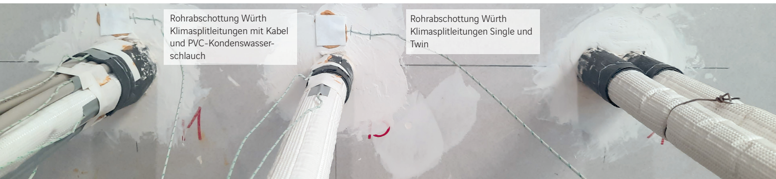
Rohrabschottung Würth Klimasplitleitungen mit Kabel und PVC-Kondenswasser- schlauch