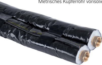
Würth Solarleitungen Edelstahlwellrohr-Solar