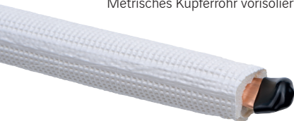
Würth Klimasplitleitungen Metrisches Kupferrohr vorisoliert Single