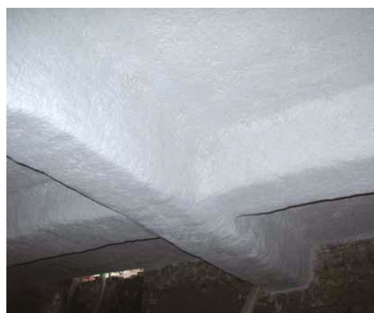
Dämmung einer Kellerdecke einschließlich der Betonunterzüge. Oberfläche geglättet und verfestigt