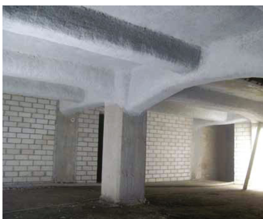
Kellergewölbe mit 100 mm Mineralfaserputz als F 90 Brandschutz-Spritzputz mit Wärmedämmfunktion

Mineralfaser-Spritzputz erfüllt sowohl die Brandschutz- als auch die Wärmedämmanforderungen