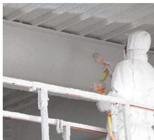
Brandschutztechnische Ertüchtigung mittels Hartputz (Vermiculite).