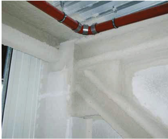
Stahltragwerk eines Dachstuhls mit Vermiculiteputz F 90 beschichtet

Bemessung der Schichtdicke nach U/A-Verhältnis