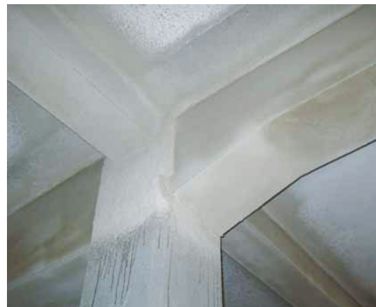
Geglätteter Vermiculiteputz an Betonunterzügen