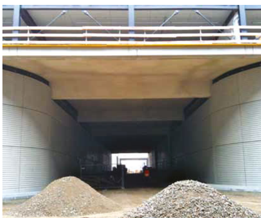
Tunneleinfahrt am Flughafen Berlin (BBI). Decke mit Vermiculiteputz in F 90 nach Tunnelbaukriterien ZTV

Höchste Brandbeanspruchungskriterien werden erfüllt: bis F 240