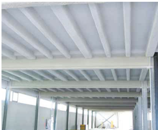
Mit Vermiculiteputz ertüchtigte Betonrippendecke einer Lagerhalle

Bemessung der Schichtdicke entsprechend der fehlenden Betondecke bzw. Betonüberdeckung der Armierung