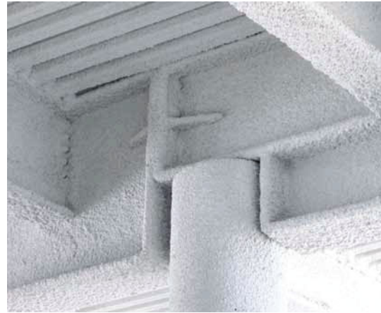
Deckenträger mit Perliteputz F 30