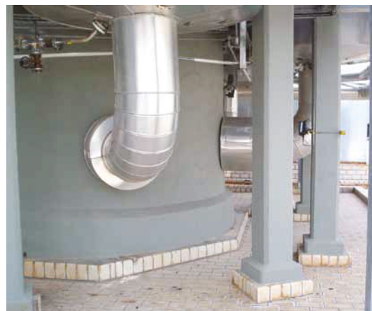
Kolonnenstandzarge und Stahlstützen mit Vermiculiteputz, Sockelschrägen, Schutzanstrich und Acrylabdichtung

Spezialanstrich und Acrylabdichtung als Witterungsschutz