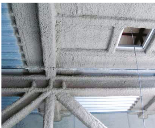
Beschichtete Stahlträger mit Vermiculiteputz einschließlich Feuerüberschlagbarriere am aufliegenden Stahltrapezblechdach

Bemessung der Schichtdicke nach Zulassungs- und Prüfzeugnisangaben