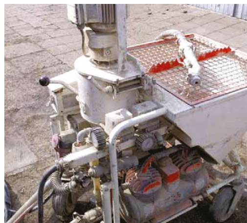
... werden verschiedene Misch- und Fördersysteme benötigt.