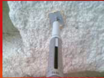
Die Haftzugfestigkeit wird abschließend kontrolliert