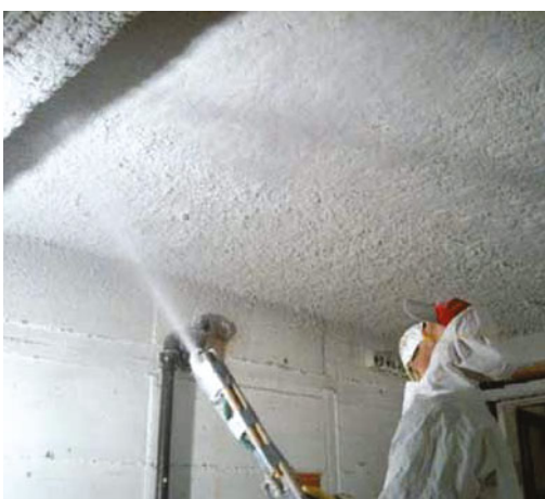
Aufbringen von MF-Putz als Wärme- und/oder Brandschutz.