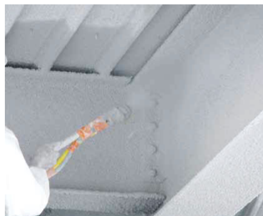
Trapezblechdecke mit Aufbeton wird zusammen mit dem Stahltragwerk beschichtet