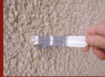
Messung der Schichtdicken während und nach der Beschichtung