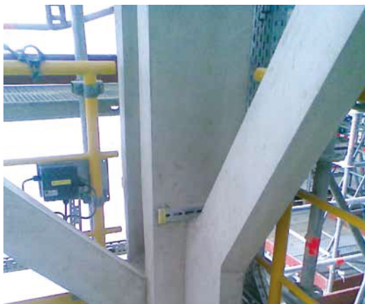
Vermiculiteputz an Stahlprofilen eines Reaktorturms einer Raffinerie

Erhöhte Anforderungen für die Anwendung an Stahlkonstruktionen in Außenbereichen