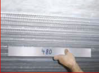
Dübelabstände werden während und nach der Montage überprüft