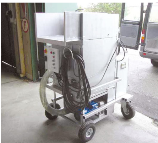
Für die unterschiedlichen Produktgruppen ...