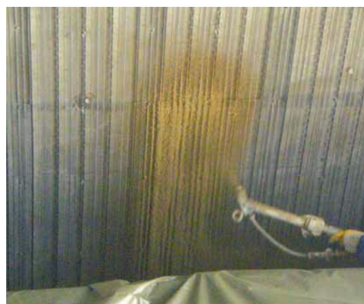
An einer Tunneldecke: Beschichtung von Vermiculiteputz. Untergrund: Putzträger- und Armierungsgitter

Zusätzliche Sicherheit durch Schutzanstriche, z. B. für Reinigung mit Bürstenfahrzeugen geeignet