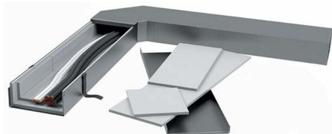
Bild 1 Der innovative PYROMENT®-EK schützt wichtige Leitungen vor einem Feuer.

Der Elektro-Installationskanal PYROMENT®-EK gehört zu den neuesten Innovationen der G+H Group – er schützt elektrische Leitungen bei einem Brand von außen. So auch in dem Groß-Rechenzentrum in Leipzig. Hier wurden ca. 100 m des E-Kanals