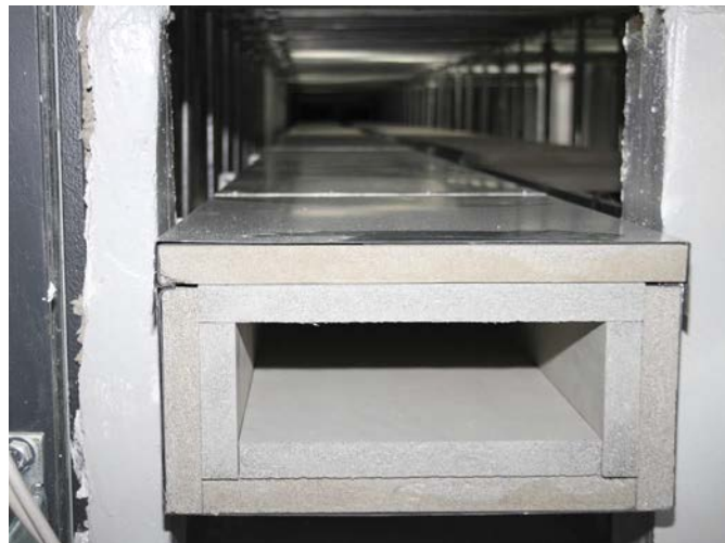
Bild 2 Den Monteuren stand eine Arbeitshöhe von nur 90 Zentimetern zur Verfügung. Die einfache Handhabung des E-Kanals erleichterte den Einbau erheblich.