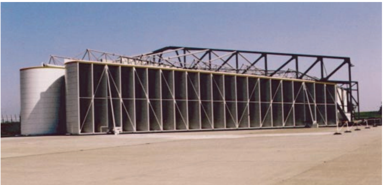
Öffenbares Tor mit Schalldämpferkulissen für Lärmschutzhalle

Bei Kombinationen mit aktiven Schalldämpferkomponenten arbeitet G+H mit einschlägigen Firmen kooperativ zusammen.