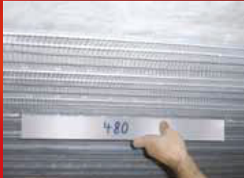
Dübelabstände werden während und nach der Montage überprüft