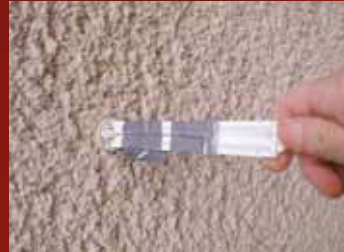
Messung der Schichtdicken während und nach der Beschichtung